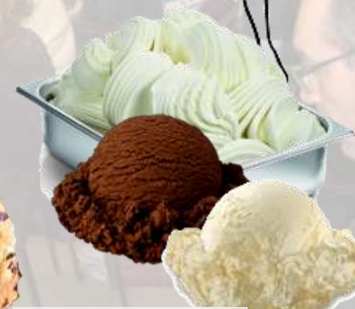
СЛАДОЛЕДИ БЕЗ ЗАХАР със сгъстител НЕВИЯ (със стевия) на ФАБРИ