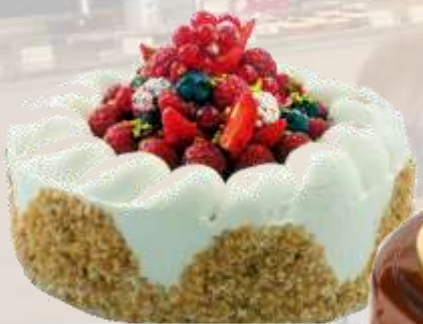
ЧИЗКЕЙК ТОРТА БЕЗ ЗАХАР с крем сирене на ЕЛЕВИР