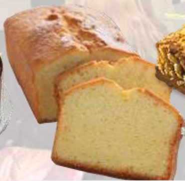
КЕЙКОВЕ БЕЗ ЗАХАР ванилов, паприка, краставици и др. с ДИАВИВА БРАШНО