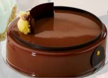
ШОКОЛАДОВА ТОРТА БЕЗ ЗАХАР с ЛЕШНИКОВ КРЕМ АРТЕГУРМЕ