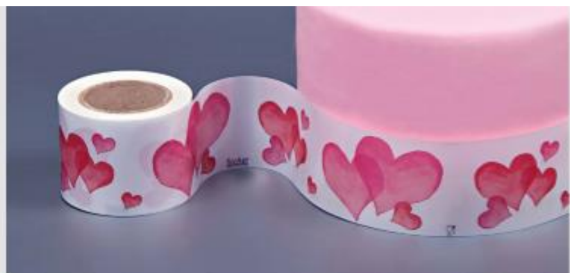
ΚΟΡΔΕΛΑ FOOD SAFE - M439703