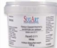
ΛΕΥΚΟ ΧΡΩΜΑ E365302 100g