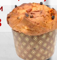
ПАНЕТОНЕ ЛИЕВИТО МАНДРЕ оценка 9,99