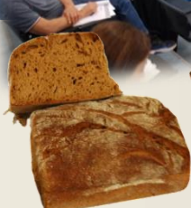
ПЪЛНОЗЪРНЕСТ РЪЖЕНО-ПШЕНИЧЕН БЮКЕР традиционал оценка 9,43/10