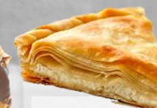
БАНИЦИ СЪС СЕЛСКИ КОРИ оценка 9,28