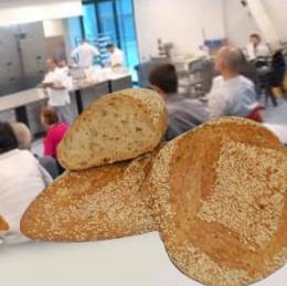
ДЕСЕТЗЪРНЕСТ ВИТАСОН 30% оценка 9,98/10