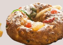
КОЛЕДЕН ПОРТОГАЛСКИ БОЛО РЕЙ оценка 9,99/10