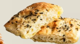
ФОКАЧА ГРАНОФЕРМ СТИРАТА оценка 9,76/10