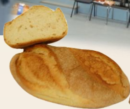
СЕЛСКИ ЗАКВАСЕН БЮКЕР ВИНО оценка 9,12/10