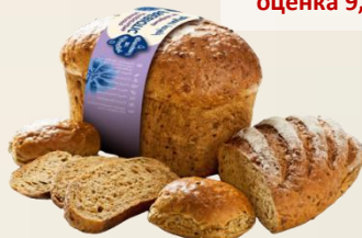
ПРЕБИОТИК МНОГОЗЪРНЕСТ оценка 8,97/10