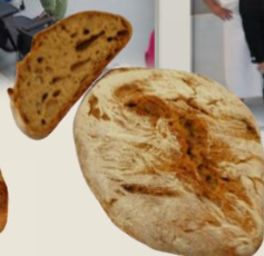
ГРАНОФЕРМ ЛИЕВИТО МАДРЕ оценка 9,99/10