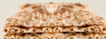
ПИНСА ЛИЕВИТО МАДРЕ ГРАНОФЕРМ СТИРАТА оценка 10/10