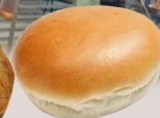
БАНС ГРАНОФЕРМ СТИРАТА оценка 9,20/10