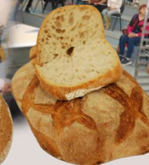
ШВЕЙЦАРСКИ ПАНЕМАГИЯ бавна фер-ция оценка 9,97/10