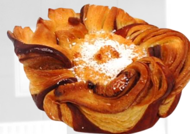
МНОГОЛИСТЕН ДВУЦВЕТЕН БРИОШ оценка 9,99