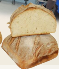
ПЛАНИНСКИ ОЛИМП БЮКЕР М90 оценка 9,46/10