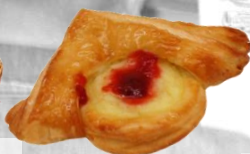
КРУАСАН Крем ФЛУ - плод оценка 9,99