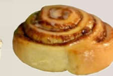
КОЛЕДЕН СИНАМОН РОЛ оценка 9,98/10