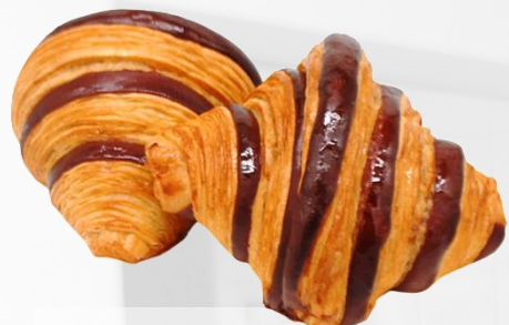
ДВУЦВЕТЕН КРУАСАН оценка 9,99

За да видите рецепта за ФРЕСКА ПАСТА с брашно „ЛИМНОС“ натиснете ТУК