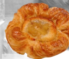
ДАТСКО ТЕСТО с ФЕРМЕНТЕ оценка 9,97