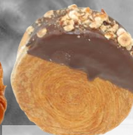
АМАЕРИКАНСКИ КРУАСАН КУЙН АМАН оценка 9,97