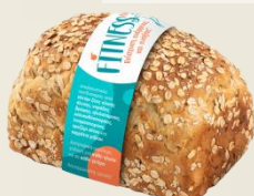
ФИТНЕС ХЛЯБ КРУСТ оценка 9,21/10