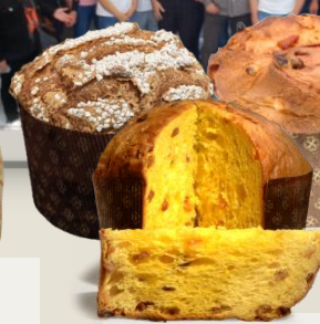
ПАНЕТОНЕ ЛИЕВИТО МАДРЕ оценка 10/10