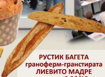
РУСТИК БАГЕТА граноферм-гранстирата ЛИЕВИТО МАДРЕ оценка 9,96/10