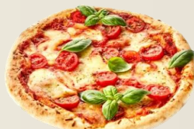
ПИЦА ГРАНОФЕРМ СТИРАТА оценка 9,87/10