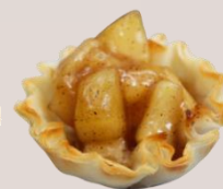
КОЛЕДЕН ЯБЪЛКОВ ПАЙ оценка 9,96/10