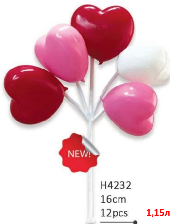
H4232 код 16cm 190509 12pcs 1,15лв/бр.