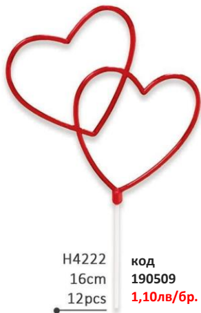
H4222 код 16cm 190509 12pcs 1,10лв/бр.