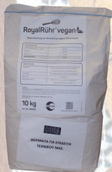
Код 180738 БРИОШ КОДА 25%