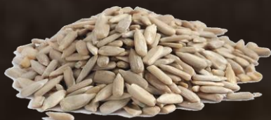
4. Слънчогледови ядки