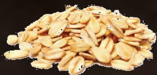
1. Овесени снежинки

Смес 50% за многозърнести традиционни хлебни изделия