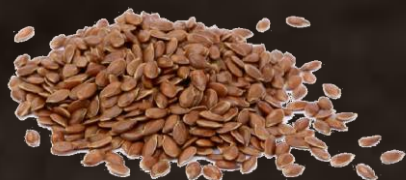
2. Ленени семена