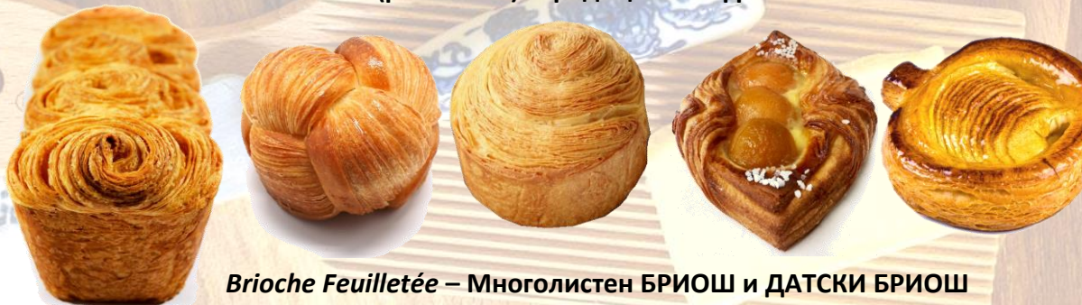
Brioche Feuilletée – Многолистен БРИОШ и ДАТСКИ БРИОШ

За рецепти и апликации, обърнете се към търговците на АЛМА ЛИБРЕ: