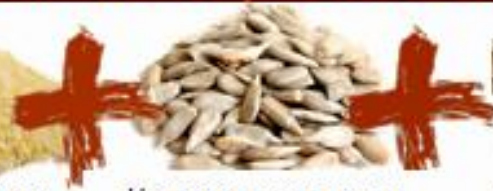
Цели слънчогледови семена, първо качество