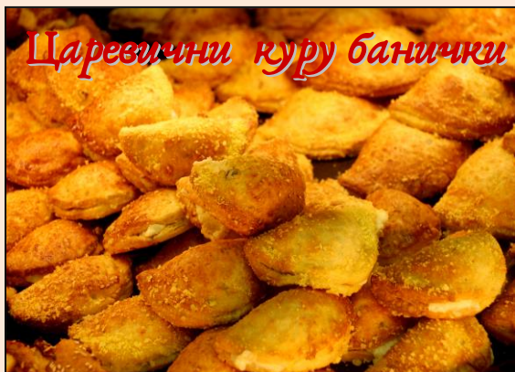
Царевични куру банички

След първата почивка от 60мин., режим по 150гр. и оформяме. Почиват топките по още 15мин. и после отваряме с ръцете върху грис. В центъра, като на гнездо поставяме сирена по желание и чушки или домати или друго и периферно дооформяме границите. След втасване и печене намазваме с малко зехтин.