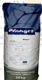
Код 180736 БРИОШ ПЛАНГ 10%