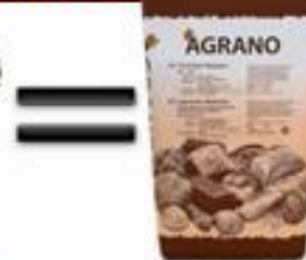
Много специален смес от подправки