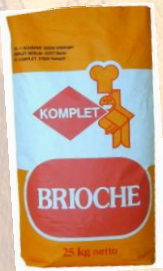
Код 270101 БРИОШ КОМПЛИТ 50%