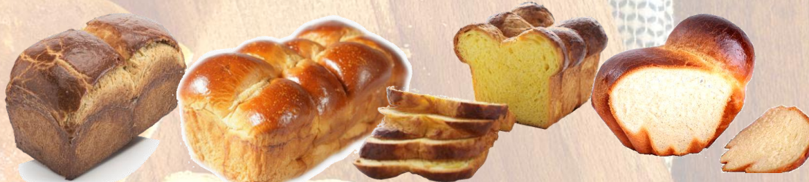
Brioche bread loaf (Nanterre) - Хляб БРИОШ за закуска и основно хранене