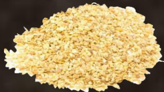
3. Едро смляна соя