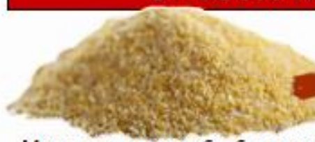
Много специална обработка на царевични гранули

от 100% натурални продукти (чист етикет)