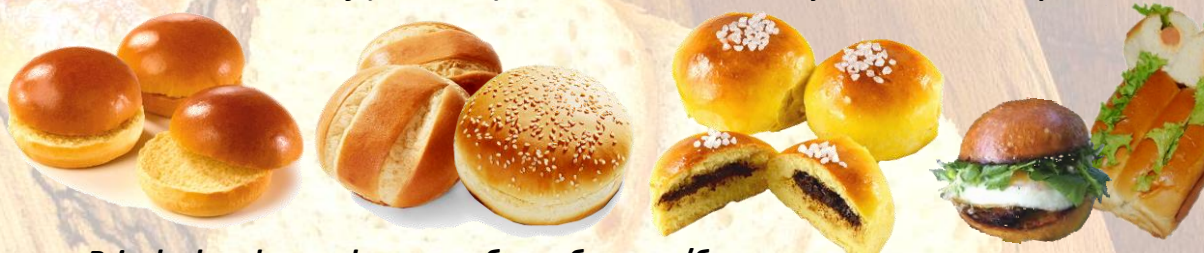
Brioche hamburger buns - хлебчета бургери/банс за солени и сладки пълнежи