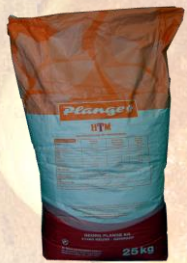
Код 180727 БРИОШ ПЛАНГ 100%

АЛМА ЛИБРЕ осигурява рецепти и технологии за всичките разновидности БРИОШ: