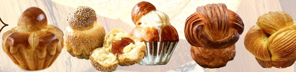
Brioche à tête (parisienne) - традиционен френски БРИОШ