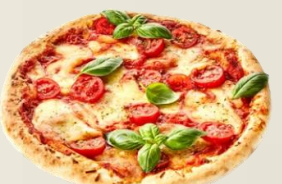
ПИЦА ГРАНОФЕРМ СТИРАТА оценка 9,87/10