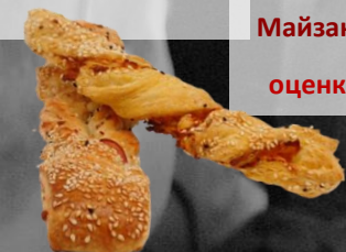
МНОГОЛИСТНА ЦАРЕВИЧНА Майзано-аграно оценка 9,67