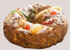
КОЛЕДЕН ПОРТУГАЛСКИ БОЛО РЕЙ оценка 9,99/10