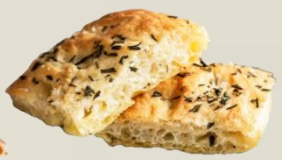
ФОКАЧА ГРАНОФЕРМ СТИРАТА оценка 9,76/10