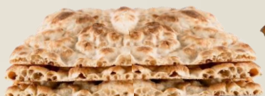
ПИНСА ЛИЕВИТО МАДРЕ ГРАНОФЕРМ СТИРАТА оценка 10/10