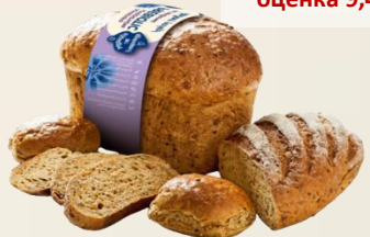
ПРЕБИОТИК МНОГОЗЪРНЕСТ оценка 8,97/10