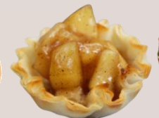
КОЛЕДЕН ЯБЪЛКОВ ПАЙ оценка 9,96/10