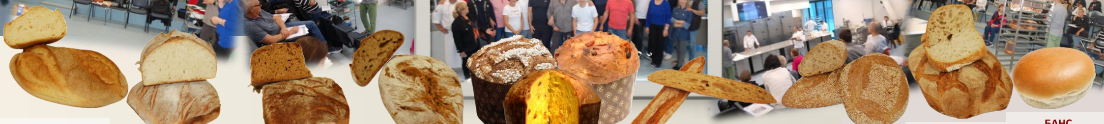
СЕЛСКИ ЗАКВАСЕН БЮКЕР ВИНО оценка 9,12/10