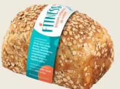
ФИТНЕС ХЛЯБ КРУСТ оценка 9,21/10