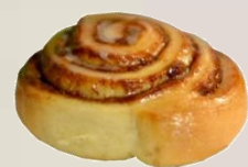
КОЛЕДЕН СИНАМОН РОЛ оценка 9,98/10