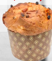
ПАНЕТОНЕ ЛИЕВИТО МАНДРЕ оценка 9,99