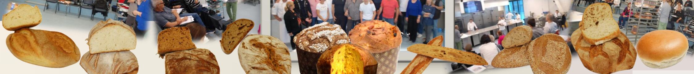
СЕЛСКИ ЗАКВАСЕН БЮКЕР ВИНО оценка 9,12/10