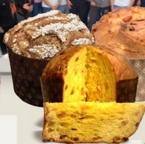
ПАНЕТОНЕ ЛИЕВИТО МАДРЕ оценка 10/10