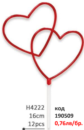
H4222 код 16cm 190509 12pcs 0,76лв/бр.