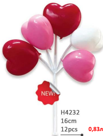
H4232 код 16cm 190509 12pcs 0,83лв/бр.