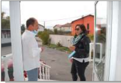
посрещаме внимателно гостите

Посрещаме гостите-партньори на АЛМА ЛИБРЕ, в специално оформените две зали на АЛМА ЛИБРЕ спазвайки максимално епидемичните мерки. Богатите разговори с консултантите, технолозите и търговците на АЛМА ЛИБРЕ преди и след дегустациите