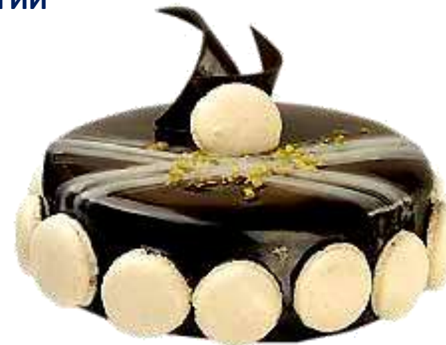
Сладкиш с МАСТИХА ХИОС – „СРЕДИЗЕМНОМОРСКИ ДИАМАНТ“