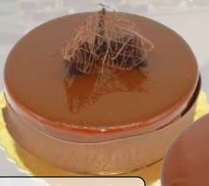
торта ЧОКОФАЙН „СОЛЕН КАРАМЕЛ“