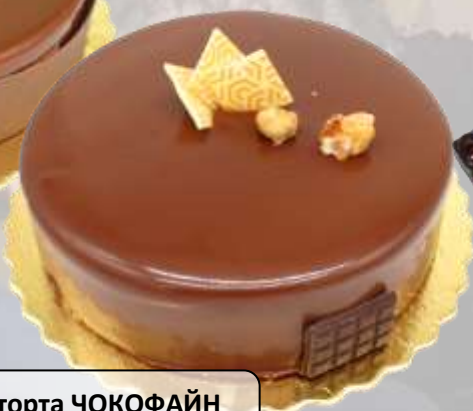
торта ЧОКОФАЙН „ГРАНД МАРНИЕ“