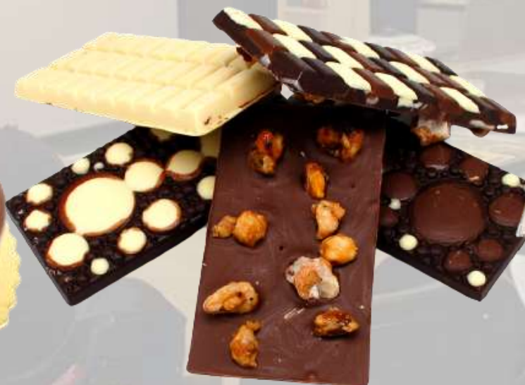
РЪЧНИ ЗАНАЯТЧИЙСКИ ШОКОЛАДОВИ ТАБЛЕТИ ЧОКОФАЙН