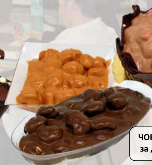
ЧОКОФАЙН САЛЦИ за „ПРОФИТЕРОЛ“