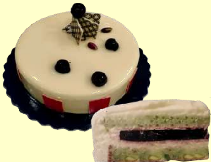
Сладкиш с МАСТИХА ХИОС – „СРЕДИЗЕМНОМОРСКИ ДИАМАНТ“