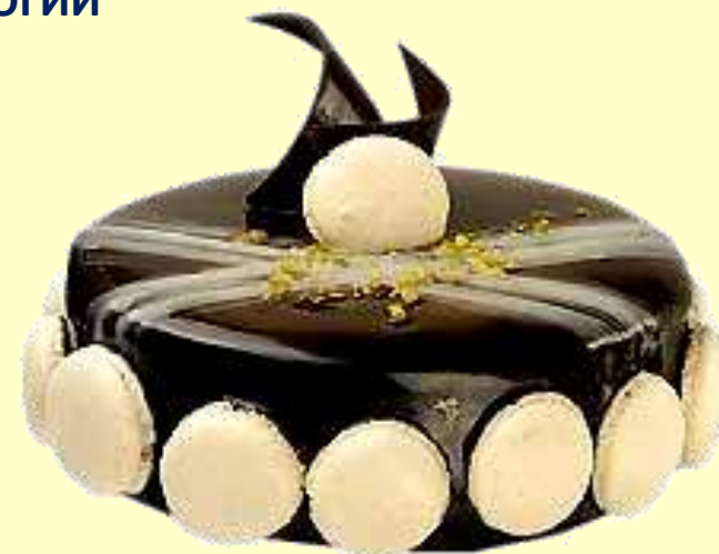
Сладкиш с ПАНАКОТА - „ПЕРУ“