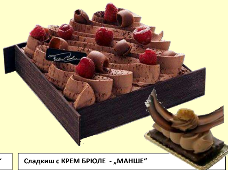
Сладкиш с КРЕМ БРЮЛЕ - „МАНШЕ“