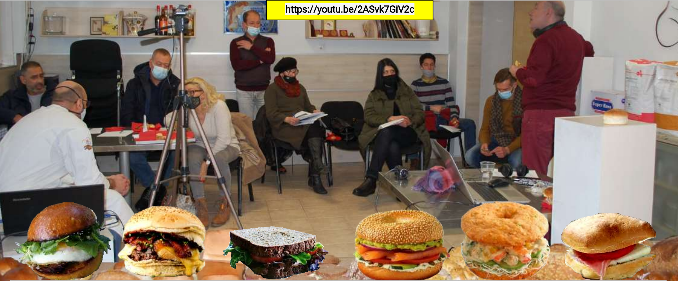
ОРИГИНАЛЕН БРИОШ КЛАСИЧЕСКИ БУРГЕР ДИНГЕЛ И ЗДРАВЕ ДИЕТИЧЕН БАГЕЛ ЦАРЕВИЧЕН БАГЕЛ ЧИАБАТА ДУРУМ Следващия ден, на 27 януари ограничен брой гости в АЛМА ЛИБРЕ ЦЕНТЪР и десетки зрители по интернет-зоом пряка връзка следяха на живо презентацията на 6 нови оригинални рецепти за сандвичи